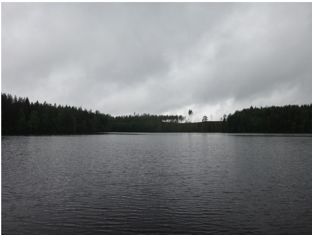
Ylimmäisen Hauklammen ilme oli synkkä 24.6.2015.

Happipitoisuus on todennäköisesti tärkein yksittäinen ympäristötekijä järven ekosysteemissä. Hapen puute hidastaa vesistön hyvinvoinnille tärkeitä hajotustoimintoja. Rehevissä vesissä tilanne on vakavin lämpötilakerrostuneisuuden aikana, jolloin alusvesi ei saa happitäydennystä ilmakehästä, mutta happea kuluu pohjalle joutuneen ja sinne päällysvedestä vajoavan orgaanisen materiaalin hajoamiseen.