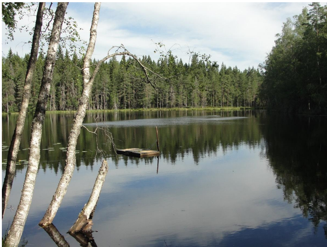
Kuva: Vilthattu heinäkuussa.

Vesi oli 20,7-asteista, hapanta (pH 6,1) ja hygieenisesti laadultaan hyvää vettä. Kokonaisfosforipitoisuus ilmentää rehevää vettä. A-klorofyllipitoisuus oli suuri ilmentäen suurta levätuotantoa. pH ollessa alhainen ei ole kovin todennäköistä, että kyseessä olisi kuitenkin sinilevien vaan pikemminkin kultalevien, piilevien, panssarilevien tai muiden alhaisen happamuuden rehevillä järvillä dominoivat levälajit. Pohjan rikkivedyn tuoksu johtui hapen loppumisesta läheltä pohjaa, pintavedessä hapetta oli tyydyttävästi.