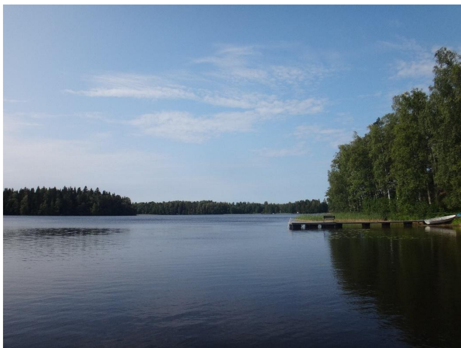
Vihtijärveä heinäkuussa 2019

Vihtijärven vedenlaatu oli hieman heikentyneestä tilanteesta huolimatta hyvä. Veden hygieeninen laatu oli erinomainen, vain 1-2 yksittäistä suolistobakteeria havaittiin hygienia mittauksissa.