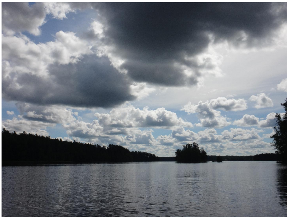
Vihtijärvi 27.7.2017.

Vihtijärven vesinäytteistä analysoitiin järven perustilaa kuvaavia ominaisuuksia. Analyysien tulkinnan perusteita on esitetty raportin lopussa. Mitattujen vedenlaatuominaisuuksien perusteella järven tila oli hyvä: