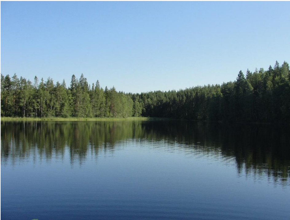
Kuva: Valkjärveä heinäkuussa 2018.

Vesi oli lämmintä, (24,5-asteista), happamuudeltaan neutraalia ja laadultaan kaiken puolin erinomaista ilmentäen mm. lammen karuutta. Vedessä oli runsaasti happea myös pohjan lähellä. Päällysvedessä levätuotannosta kertova klorofylli-a ilmensi myös karua vettä. Veden hygieeninen tila oli erinomainen.