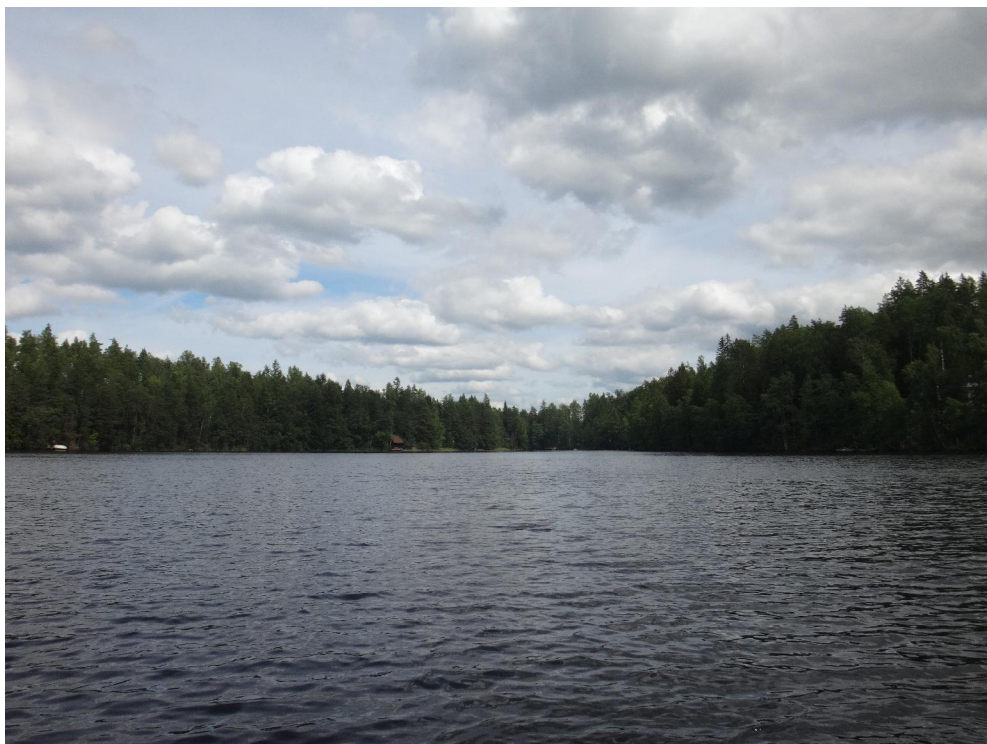
Valkjärvi 27.7.2017.

Valkjärven vesinäytteistä analysoitiin järven perustilaa kuvaavia ominaisuuksia. Analyysien tulokinnan perusteita on esitetty raportin lopussa. Mitattujen vedenlaatuominaisuuksien perusteella järven tila oli hyvä: