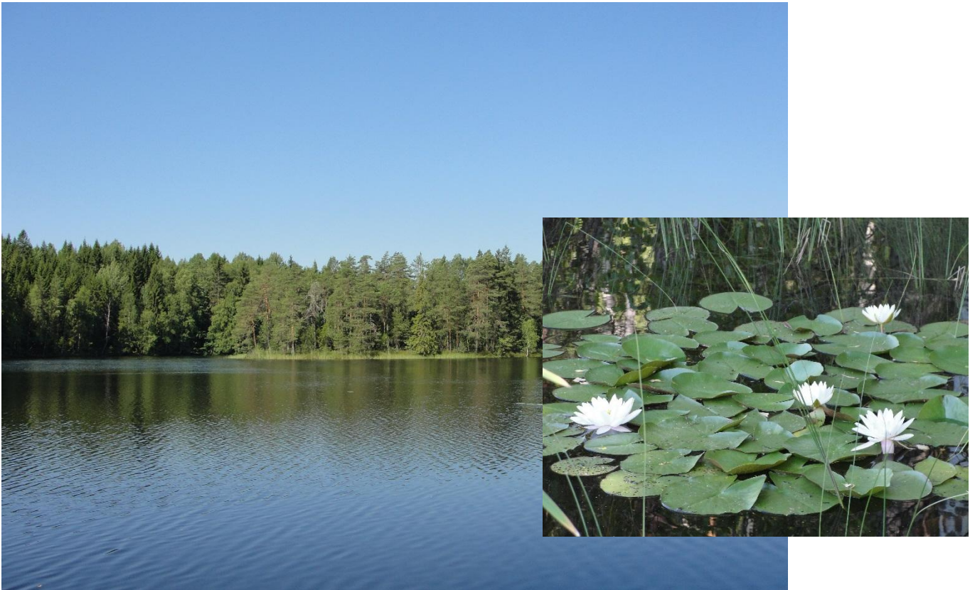
Kuva: Saarlampi, Järvenpää heinäkuussa. Järvessä esiintyy kauniita valkokukkaisia lumpeita, 18.7.2018.

Veden lämpötila oli pinnassa 24,2 °C ja pohjan lähellä (2,0 metrissä) 19,8 °C. Vesi oli happamuudeltaan lähellä neutraalia ja hygieenisesti laadultaan hyvää vettä. Ravinnepitoisuudet ilmensivät karua tai lievästi rehevää vettä. A-klorofyllipitoisuus oli melko alhainen ilmentäen lievää rehevyyttä. Levätuotannosta johtuen veden happikylläisyys oli yli 100 %.