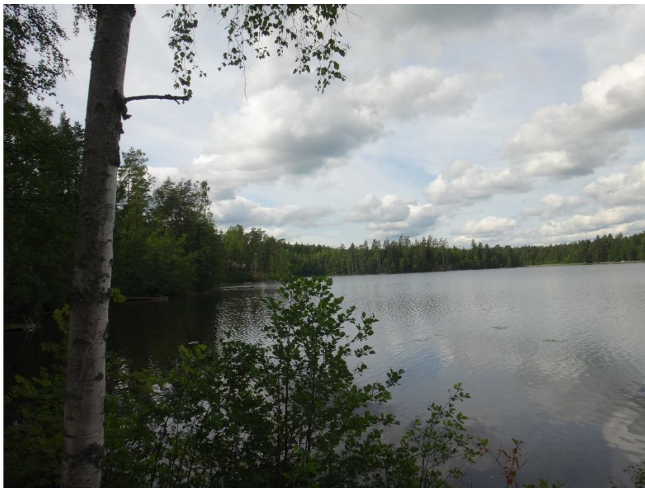
Petäys 27.7.2017.

Petäyksen vesinäytteistä analysoitiin järven perustilaa kuvaavia ominaisuuksia. Analyysien tulkinnan perusteita on esitetty raportin lopussa. Mitattujen vedenlaatuominaisuuksien perusteella: