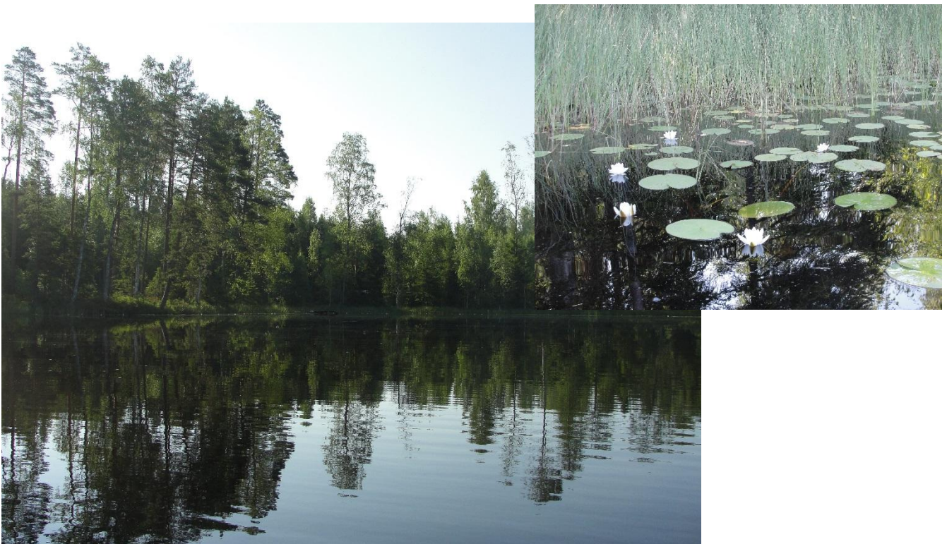
Kuva: Mustikainen heinäkuussa 2018. Lammen rantaa koristaa kauniit ja tuoksuvat Isolumpeet.

Päälyysvedessä levätuotannosta kertova klorofylli-a ilmensi lievää rehevyyttä ja kokonaisravinteet (fosfori ja typpi) lievästi ravinteikasta vettä. Viileässä alusvedessä lähellä pohjaa ravinteita oli sedimentin hapettomuudesta johtuen liuennut veteen ja kokonaispitoisuudet olivat kaksinkertaistuneet päälyysveteen verrattuna. Nämä ravinteet eivät kuitenkaan päässeet päälyysveteen lämpötilaeron vuoksi eikä siten lisää esim. lammen levätuotantoa. Myös veden ruskea väri pienentää valon läpäisykykyä ja ehkäisee luonnostaan levätuotantoa lammessa. Veden hygieeninen tila oli hyvä.