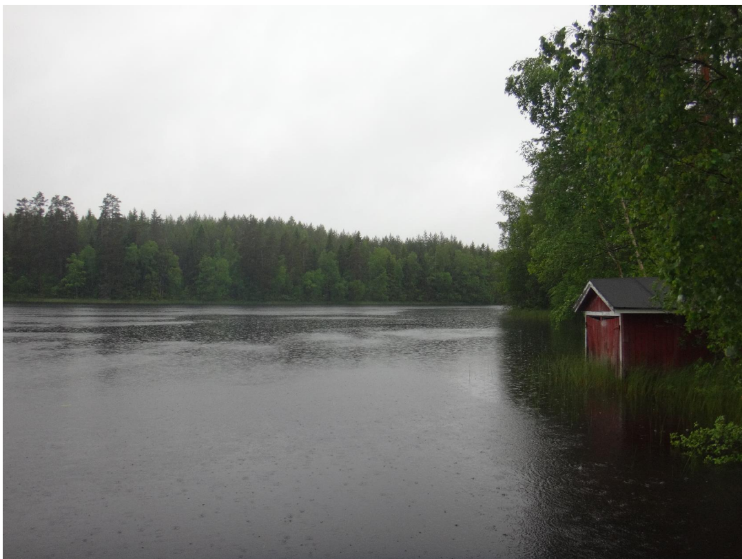
Muslammilla satoi vettä 24.6.2015.

Happipitoisuus on todennäköisesti tärkein yksittäinen ympäristötekijä järven ekosysteemissä. Hapen puute hidastaa vesistön hyvinvoinnille tärkeitä hajotustoimintoja. Rehevissä vesissä tilanne on vakavin lämpötilakerrostuneisuuden aikana, jolloin alusvesi ei saa happitäydennystä ilmakehästä, mutta happea kuluu pohjalle joutuneen ja sinne päällysvedestä vajoavan orgaanisen materiaalin hajoamiseen.