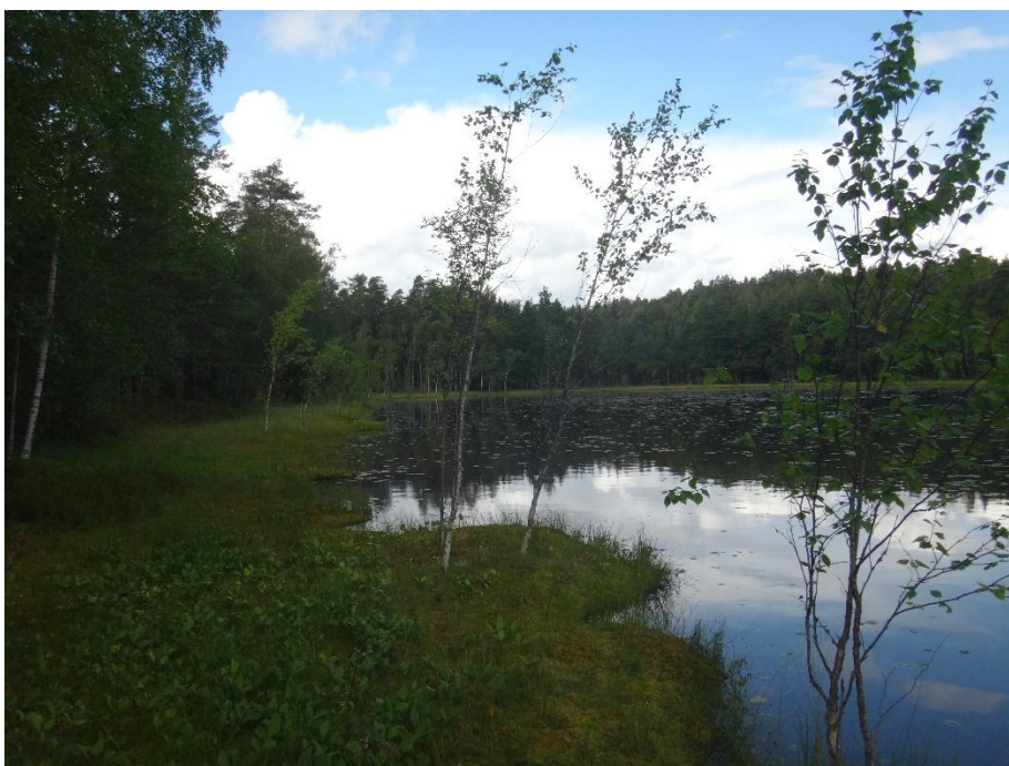
Luntotrasket elokuussa 2019.

Vesi oli humuksesta ruskeaksi värjäytynyt (väriluku 80 Pt/mg) mutta myös lievästi sameaa (FNU 3,0). Myös kemiallinen hapenkulutusluku (COD mn 14 mg O 2 /l) ilmensi humusleimaa järven vedessä. Metsäisestä ympäristöstä huolimatta vesi oli lisäksi melko ravinteista, raja-arvojen perusteella jo rehevää (kokonaisfosfori 26 µg/l ja kokonaistyyppi 520 µg/l). Levätuotannosta kertova a-klorofyllipitoisuus oli hieman koholla (13 mg/l). Suolistobakteereita oli vähän ( Eschericia coli 10 ppm/100 ml), ja ne ilmensivät jonkin verran myös poikkeamasta järven luonnontilasta. Hapetta oli hyvin, mikä kesäaikaan on luonnollista tällaisessa matalassa järvi-alueella, missä vesi sekoittuu helposti tuulten aiheuttamana pohjasta pintaan. Vesi oli lievästi hapanta (pH 6,5). Likaantumisen yleisindikaattori sähkönjohtokyky oli alhainen samoin kuin alkaliteettikin, mitkä toisaalta kertovat vain lievästä ihmistoiminnan vaikutuksesta.