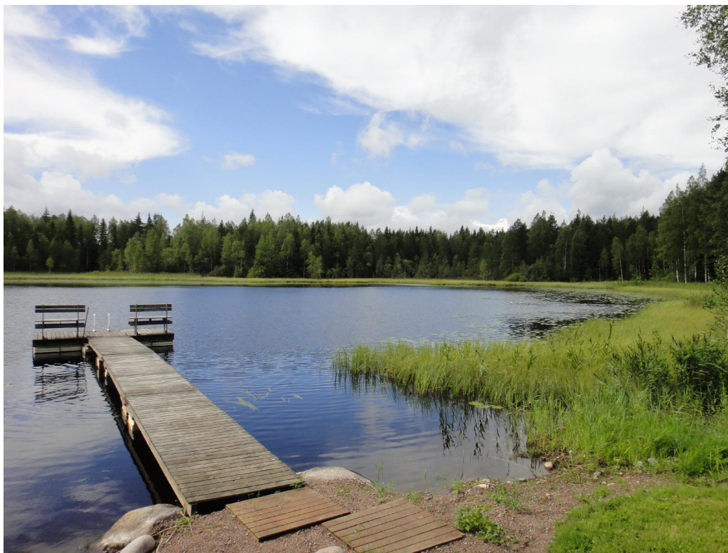
Kalvana elokuussa 2014.

Happipitoisuus on todennäköisesti tärkein yksittäinen ympäristötekijä järven ekosysteemissä. Hapen puute hidastaa vesistön hyvinvoinnille tärkeitä hajotustoimintoja. Rehevissä vesissä tilanne on vakavin lämpötilakerrostuneisuuden aikana, jolloin alusvesi ei saa happitäydennystä ilmakehästä, mutta happea kuluu pohjalle joutuneen ja sinne päällysvedestä vajoavan orgaanisen materiaalin hajoamiseen.