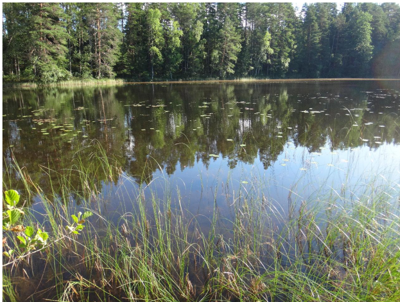
Kaitalammi 3.8.2017.