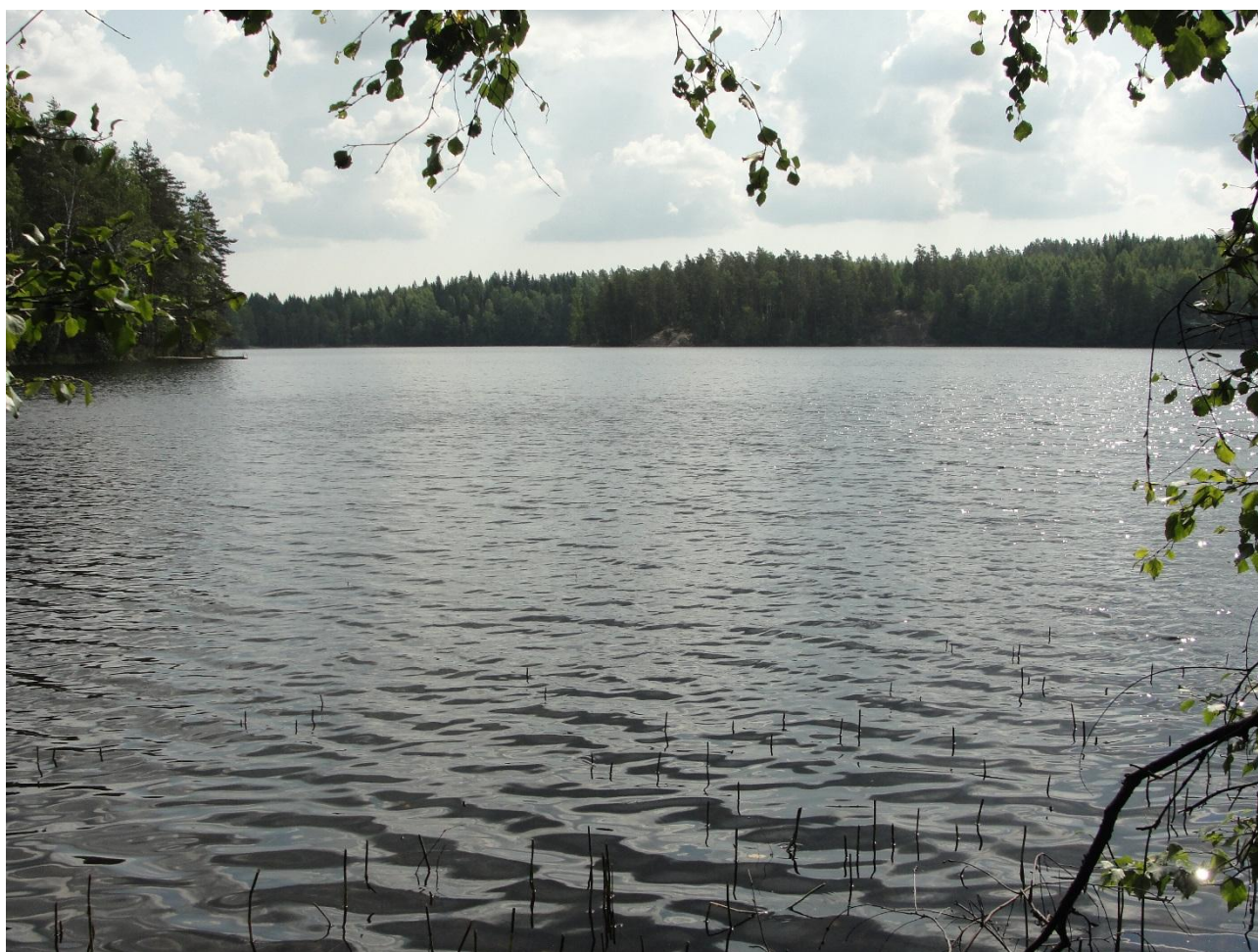
Kuva: Iso-Antias, Vihdin kunnassa, Nuuksion kansallispuistoalueella sijaitseva järvi. Valokuva 2.8.2018.

Päälyysvedessä alhaisesta levätuotannosta kertova klorofylli-a pitoisuuden lisäksi myös kokonaisravinnepitoisuudet (fosfori ja typpi) olivat alhaisia ilmentäen karua vettä. Veden sisältämää ravinteita oli kertynyt alusvedeen lähelle pohjaa hieman enemmän kuin oli ollut pintavedessä. Veden hygieeninen tila oli erinomainen.