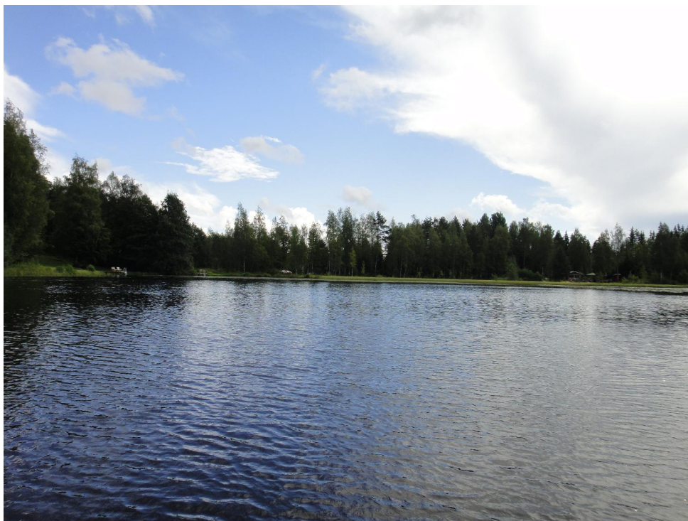
Ikainen elokuussa 2014.

Happipitoisuus on todennäköisesti tärkein yksittäinen ympäristötekijä järven ekosysteemissä. Hapen puute hidastaa vesistön hyvinvoinnille tärkeitä hajotustoimintoja. Rehevissä vesissä tilanne on vakavin lämpötilakerrostuneisuuden aikana, jolloin alusvesi ei saa happitäydennystä ilmakehästä, mutta happea kuluu pohjalle joutuneen ja sinne päällysvedestä vajoavan orgaanisen materiaalin hajoamiseen.