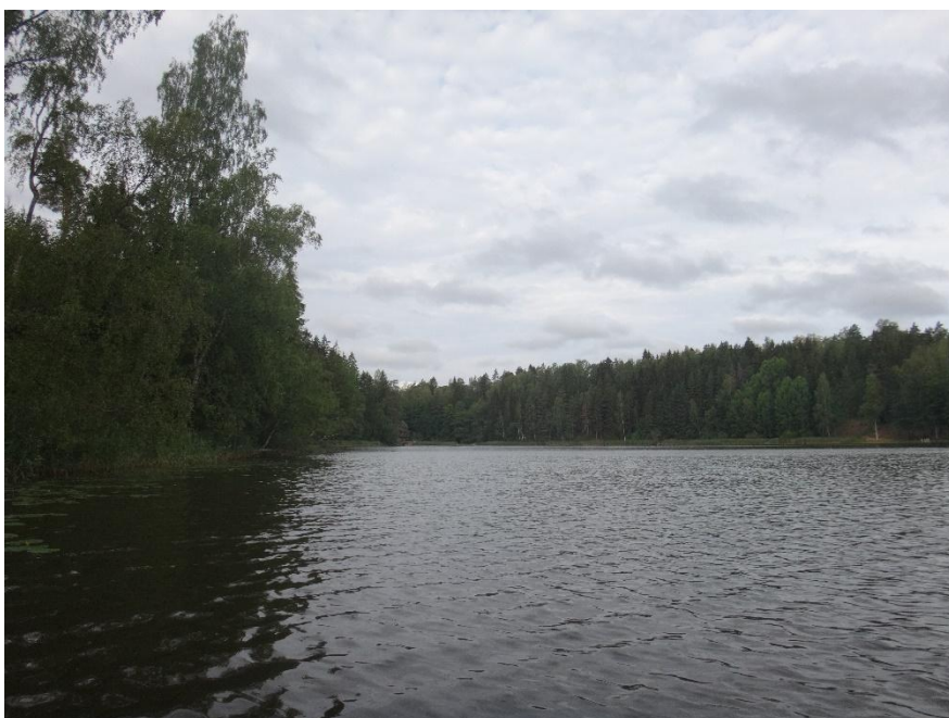
Huhmarjärveä heinäkuussa 2019.

Nämä mittaustulokset ilmensivät Huhmarjärven olevan edelleen hyvin rehevä. Huhmarjärvi on osa reittivesistöä, ja merkittävä osa rehevyydestä on peräisin sen yläpuoliselta alueelta. Huhmarjärvi on tyypiltään runsasravinteinen järvi (Rr) mutta sen tila on arvioitu olevan välttävä (vuoden 2013 arvio mukaan) eli luonnon-tilaa selvästi heikompi.