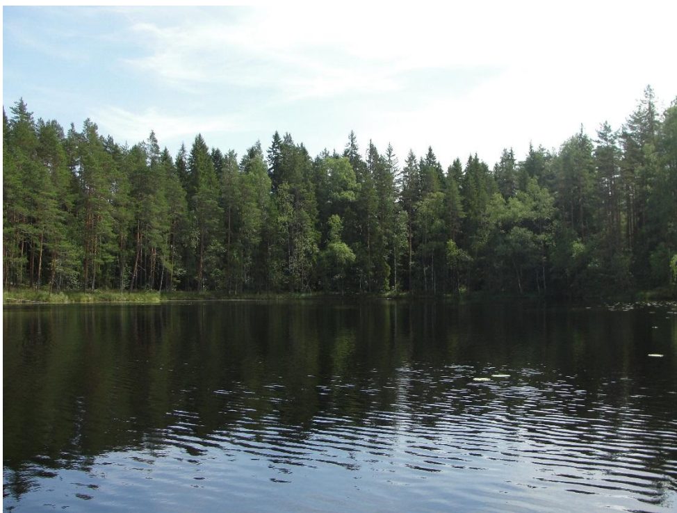
Ahvenlampi heinäkuussa (19.7.2018).

Ahvenlammi oli ravinnepitoisuuksien ja levätuotantoa ilmentävän klorofylli-a pitoisuuden perusteella karu, luonnontilaiseksi tulkittava lampi. Hapen väheneminen alusvedessä ja jopa hapeton tila lähellä pohjaa on todennäköisesti ominaista tämän tyyppisille lammille. Vaikka ravinteita pohjan hapettomuudesta johtuen vapautuu alusveteen, se ei pääse helposti päällysveteen kesän kerrostuneisuuskautena ja toisaalta myös sitoutuu levätuotannolle vaikeasti hyödynnettävään muotoon rauta- ja humuspartikkeleihin happitilanteen luonnostaan parantuessa alusveden ja päällysveden sekoittuessa.