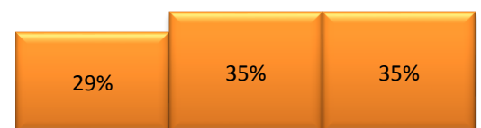
Kuva 3. Järjestelmien ikäjakauma (n=34)